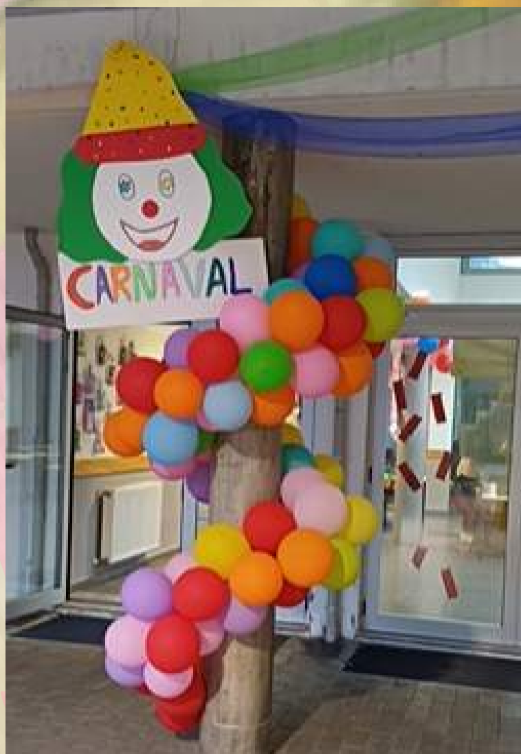
EB1/JI de Mascotelos