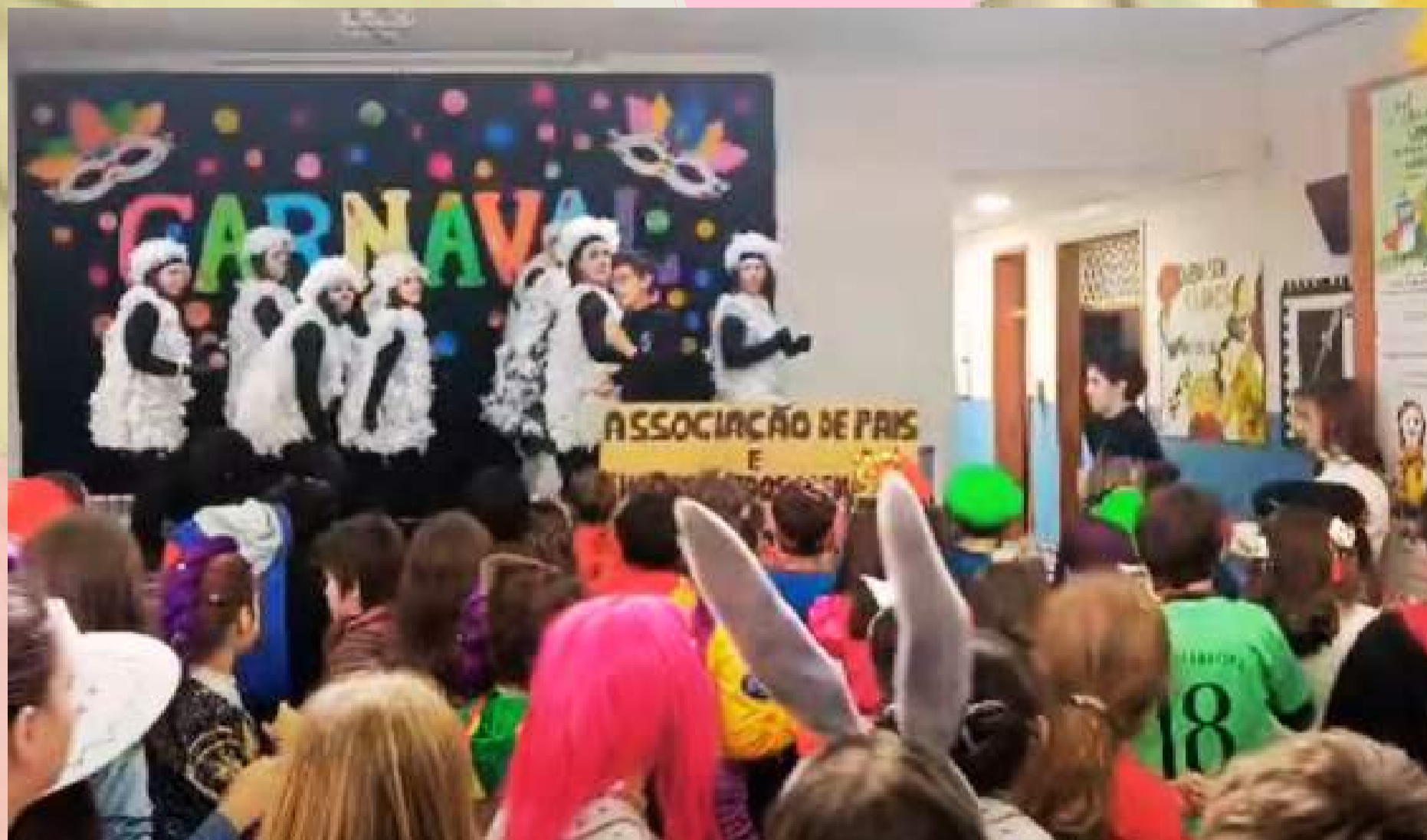
EB1/JI do Alto da Bandeira