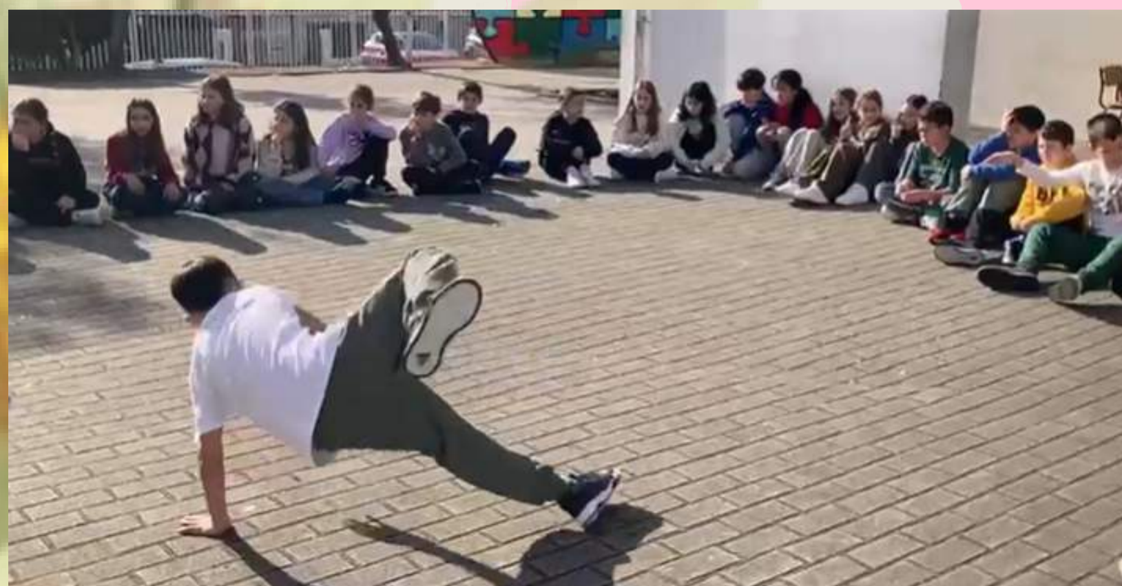
EB1/JI Alto da Bandeira